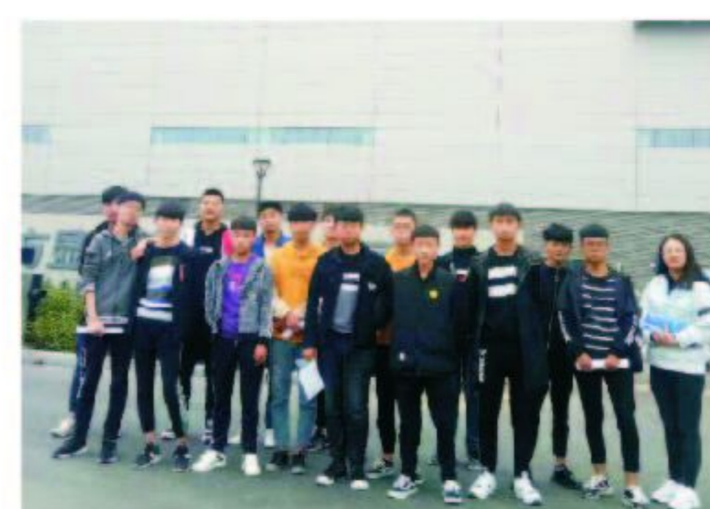
16级毕业生现就业于合肥京东方有限公司