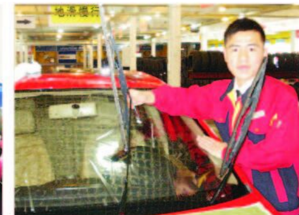
06级毕业生现就职于北京月福汽车装饰有限公司