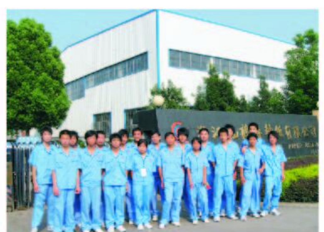
07级毕业生现就职于浙江仙鹤纸业有限公司