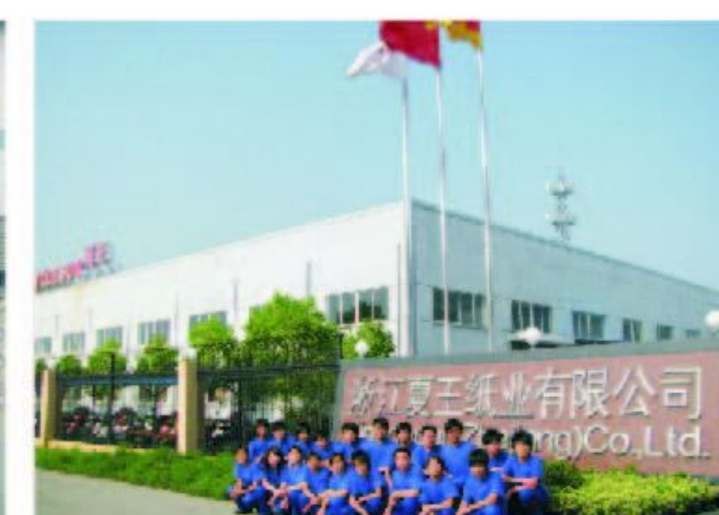
13级毕业生现就职于浙江夏王纸业有限公司