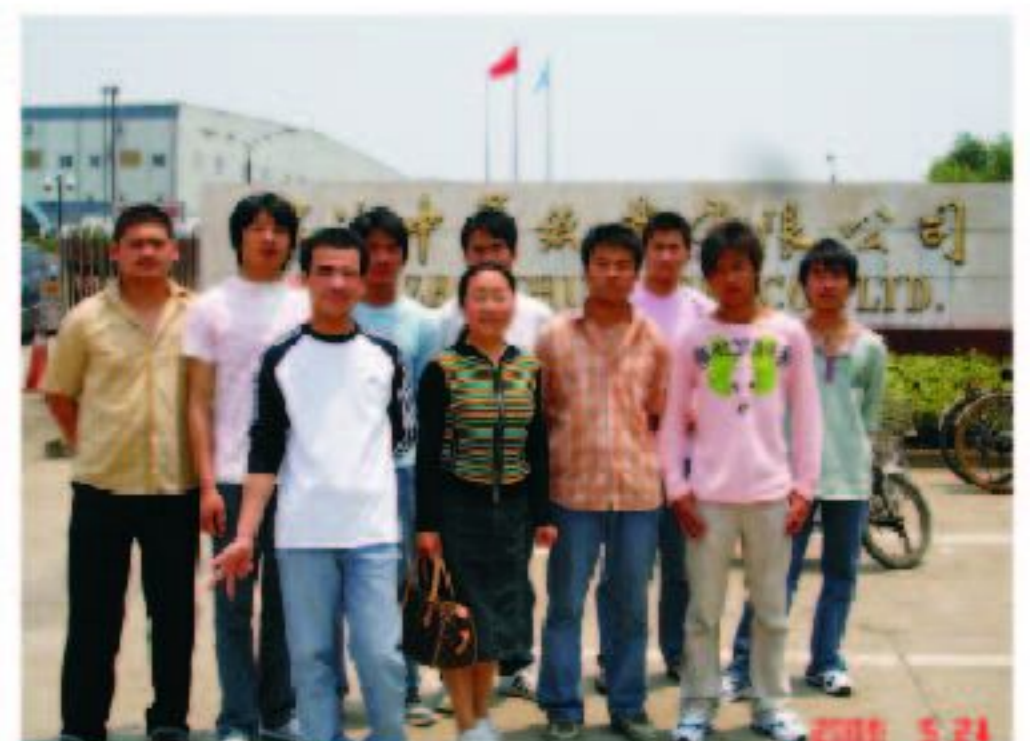
10级毕业生现就职于宁波中华纸业有限公司