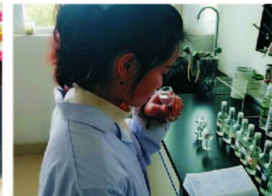
14级毕业生现就职于安徽皖酒集团