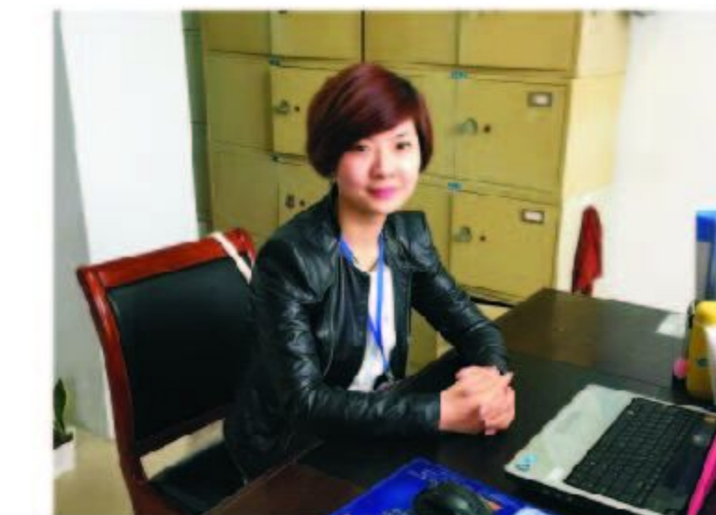
02级毕业生现就职于安徽水利股份有限公司