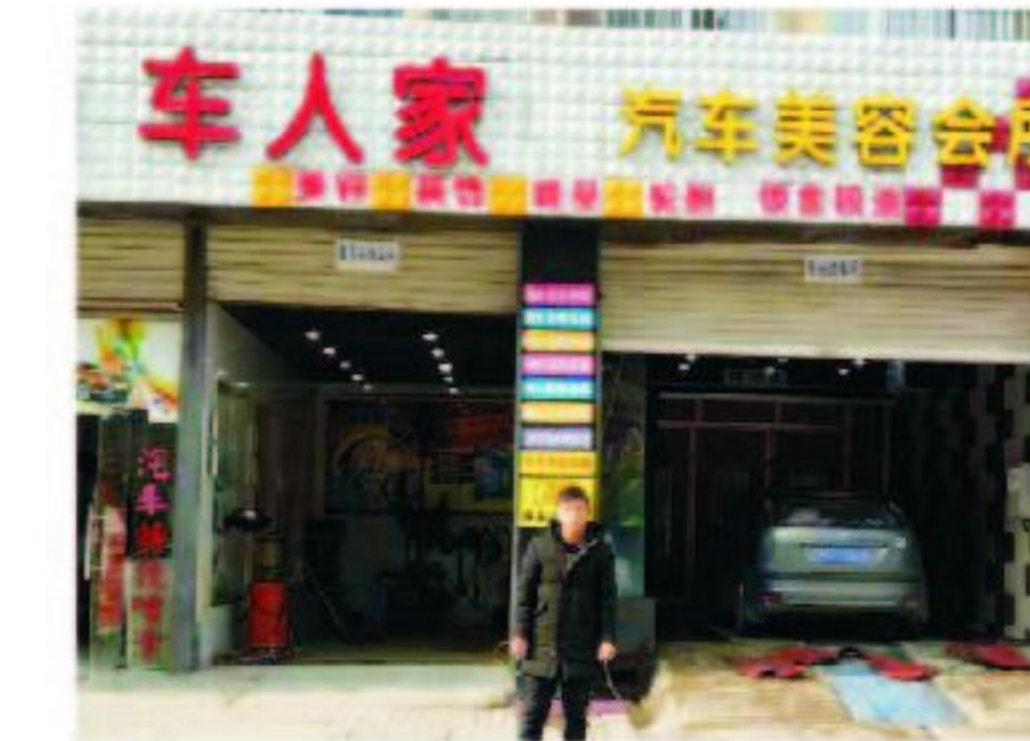
08级毕业生现创业车人家汽车美容会所