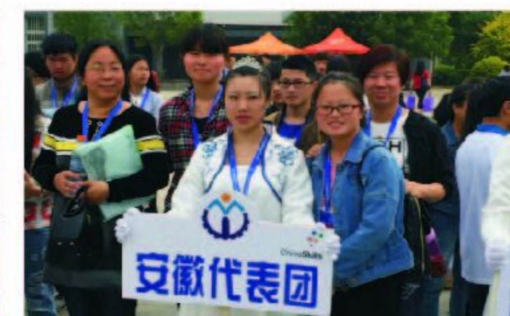
学生参加全国大赛