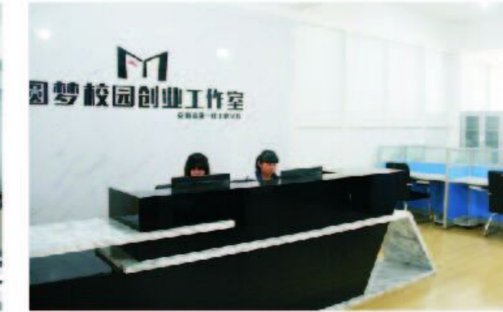
圆梦校园创业工作室