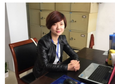
02级毕业生现就职于安徽水利股份有限公司

省外企业： 浙江仙鹤特种纸有限公司、杭州立昂微电子股份有限公司、浙江五星纸业等。