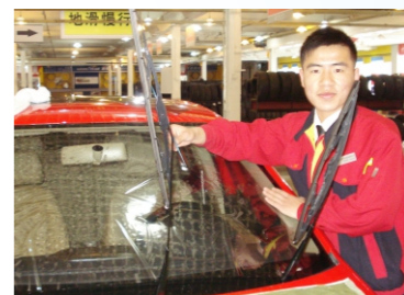
06级毕业生现就职于北京月福汽车装饰有限公司