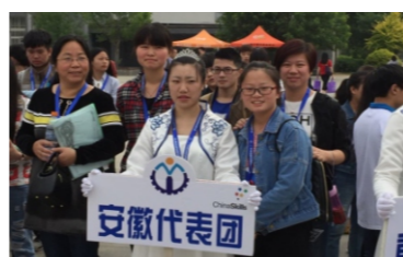
学生参加全国大赛