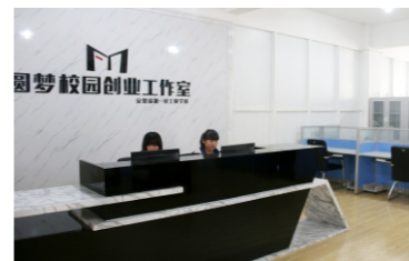
圆梦校园创业工作室